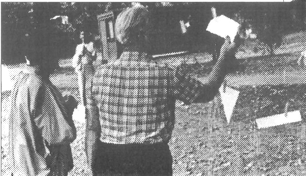
Gradani su ispisivali svoje mirovne poruke i vješali ih na uzicu. Bilo je i stranaca koji su ostavljali drugima da ih iščitavaju, a po tradiciji nekih budističkih škola, i vjetar ih je čitao kao mantr.