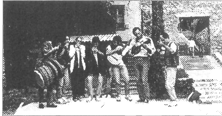
Nastupila je i zagrebačka grupa bolivijskoga folkloru Wayra

Početakom kolovoza u Zagrebu su se počeli sastajati predstavnici zagrebačkih duhovnih grupa. Tim sastancima prisustvovali su: Društvo za unapređivanje kvalitete života , Sri Chinmoy centar , Ananda marga , Komaja - društvo za razvoj ljubavi i svijesti , Sai Baba centar , Društvo za cjeloviti razvoj čovjeka , predstavnici Hare Krišne , Društvo za waldorfsku pedagogiju te nekoliko pojedinaca zainteresiranih za duhovni razvoj.