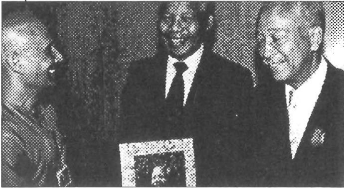
Mir ćemo naći tek kada prestanemo pronalaziti tuđe greške. Sri Chinmoy

Predstavljamo kolektivne članove Odbora antiratne kampanje